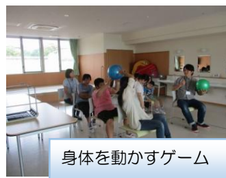
身体を動かすゲーム