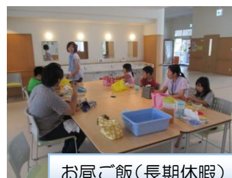
お昼ご飯(長期休暇)