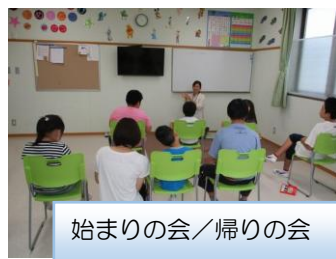
始まりの会／帰りの会