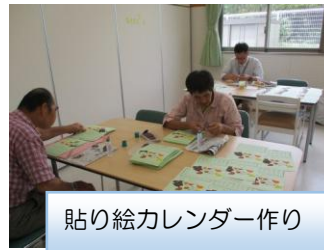
貼り絵カレンダー作り